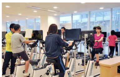
（メディカルフィットネスセンター）