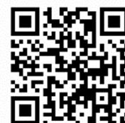
がん検診啓発動画 (YouTube)

当イベントに合わせて、2月27日(月)から、ららぽーと福岡に導入されている「女子個室トイレにおける生理用ナプキンの無料提供サービスO i T r (オイテル)」で、がん検診啓発動画（音声なし）を配信します。