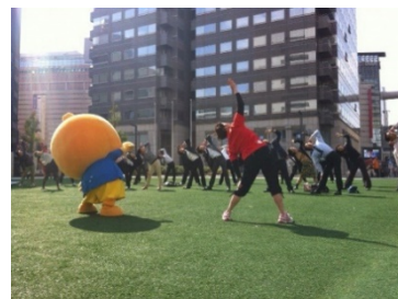
オフィス付近での体を動かすイベント