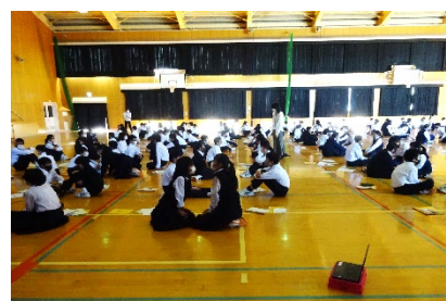
中学校でのユマニチュード講座の様子

さらに、令和3年度には認知症の人の「支援」から「活躍」へのステップアップを図るため、認知症について自主的に「知る」「考える」「つながる」「行動する」ためのコンソーシアム「福岡オレンジパートナーズ」を設立。認知症の人や企業、福祉事業者等で構成し、令和3年度末時点で81社・2団体が参画。認知症フレンドリーな商品の開発や、認知症の人が活躍できる場の創出を促進している。