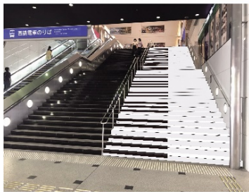
上るとピアノの音が鳴る階段

特に現役世代に顕著な健康課題である「運動不足」を解消するため、令和 4 年度から、オフィスワーカーが集まる博多駅周辺をパイロットエリアとして、公園や道路、駅などの身近な環境を活用した自然と楽しく体を動かしたくなる仕組みや仕掛けづくりを実施。