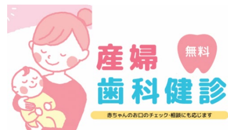
取組み例：産婦歯科健診

28 本（親知らずを除く）ある永久歯を生涯健康に保ち、健康寿命の延伸と Well-being（ウェルビーイング）の向上につなげるため、治療よりも予防に重点をおき、子どもが楽しみながら歯磨きの習慣作りができる取組みや、忙しい現役世代への定期的な歯科健診のきっかけづくりなど、ライフステージごとの特性に応じた取組みを、令和 3 年度から産学官オール福岡で実施。