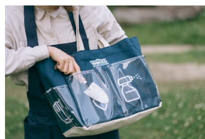
認知症の人の声を取り入れたバッグをパートナーズ参画企業が制作・販売