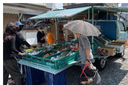
東花畑における移動販売

地域と企業等のマッチングを図り、地域の支え合いによる買い物等の生活支援を推進。令和2年度までのモデル事業において、地域特性に応じた支援の仕組みを構築。令和3年度から買い物支援推進員を増員し、買い物困難を地域課題と感じている9つの地域で取組みを実施中。買い物支援の情報発信や協力企業等の登録（令和3年度末時点32社）も推進。