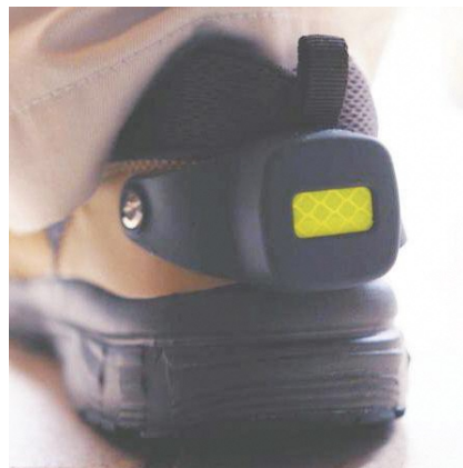
専用シリコンケース くつ型 (880円 [税込])