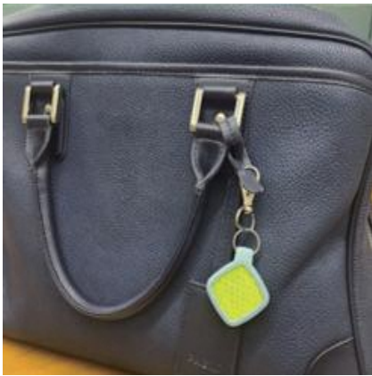
専用シリコンケース ストラップ型 (550円 [税込])