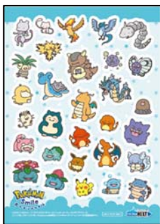
歯みがきできたねシール