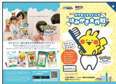
シール台紙（表紙・中面）