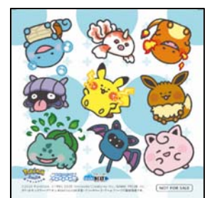
スペシャルステッカー

※健診は令和3年1月中旬～3月末まで実施 ※対象歯科医院は、健診開始までに、市ホームページ上でお知らせします。